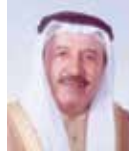
○ محافظ المحرق.

مخللة في المواطن في المأمور الأول، وهذا ما أمنت الجائحة وما صاحبها من توجيهات ملكية سامية وخبرات علمية مدروسة من قبل سمو ولي العهد رئيس الوزراء تطلعت في إطلاق الحملة.