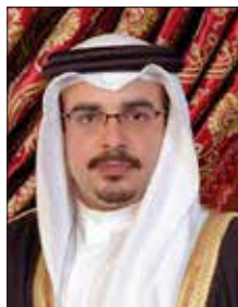
ولي العهد رئيس الوزراء

بعث صاحب السمو الملكي الأمير سلمان بن حمد آل خليفة ولي العهد رئيس الوزراء برقية تهنئة إلى الشيخ أحمد بن حمد آل خليفة رئيس الجمارك بمناسبة فوزه برئاسة مجلس منظمة الجمارك العالمية بالتركية، ككأثر شخصية عربية تتولى هذا المنصب الرفيع، أعرب سموه فيها عن خالص تهنأته لرئيس الجمارك بهذا الإنجاز الدولي الكبير الذي تحققت لمملكة البحرين.