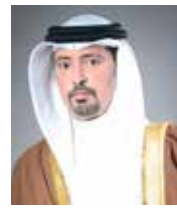
الشيخ أحمد بن حمد آل خليفة

الوزراء، وأكد أن الفوز بهذا المنصب لم يأت لو لا الدعم اللامحدود الذي توليه قيادة جلالة الملك المفدى للكفاءات المهنية المتميزة في المنظمة، وعرباً عن اعترافه بهذا الإنجاز البحريني الذي يعكس المكانة الدولية التي تتبوها البحرين بفضل ما تنطوي به المنظمة من رعاية واهتمام من وزير الداخلية الفريق أول الشيخ راشد بن عبدالله آل خليفة، منوها