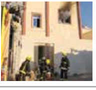
إخماد حريق في شقة عامل من دون إصابات بعالي