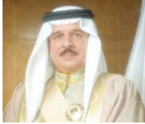
○ جلالة الملك.

الجائحة اجتذبتوا بلاء جائحة الملك المعدي وصاحب سمو ولي العهد رئيس الوزراء لمختلف مشاعرهم الوطنية ويقدموا الحب والولاء ويجندوا البيعة الإيمانية.