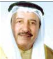
سلمان بن هندي

السمو الملكي الأمير سلمان بن حمد آل خليفة ولي العهد رئيس الوزراء الأمر الذي ساهم في الحد من تفشي هذا الوباء، مؤكداً أن ما قامت به المملكة تجاه المواطنين والمقيمين عبر فريقها الوطني الطبي بقيادة سمو ولي العهد تعتبر منهجاً ومثالاً حياً على اهتمام القيادة الحكيمة بصحة المواطن والمقيم على حد سواء. واعتبر محافظ المحرق أن الخطوات التي سارت عليها المملكة تعكس النهج القويم الذي تنتهجه البحرين نحو رؤية 2030، وترتكز على قاعدة صلبة ممتلئة في المواطن في المقام الأول.