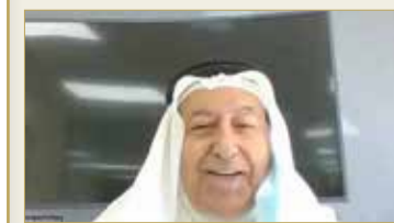
الشعلة - التعليم ركيزة نمو وتطور ورفق المجتمع

تحولت إلى حافز لهم وللجميع دورهم. وأكد أهمية قطاع التعليم شاكراً ما قدمه وزير التربية ماجد العليمي والرئيس التنفيذي لهيئة جودة التعليم والتدريب جواهر المضحي في الحديث عن المنجزات في قطاع التعليم، وقال: اعتقد أن التركيز على الجانب التعليمي شيء أساسي، لأن التعليم هو ركيزة نمو وتطور ورفق المجتمع.