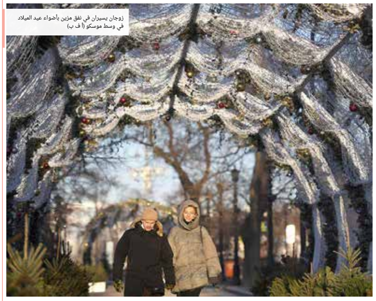
زوجان يسيران في نفق مزين بأضواء عيد الميلاد في وسط موسكو

• بادرة التحفيز: 17111444 +973 17111467 +385 @albiladpress.com local • تأسست سنة: 2008 • تصدر عن بلد البصرة للصحافة والنشر والتوزيع • صحت: 67133 • طبع في: بريدة الرياض • قسم الإعلانات: 508 / 17111501 +973 32224492 / 39615645 +973 17580939 • الاشتراكات والتوزيع: 17111432 +973 17111434 +973