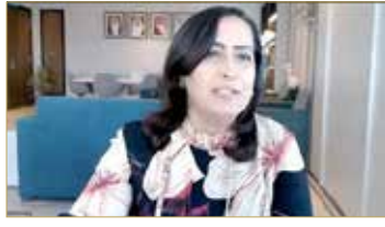
الجلالمة: إجمالية عدد الصيدليات المرخصة بالبحرين 307

السريية ولا يكون له أية أضرار. وحتى بالنسبة للتقنيات الجديدة، فالهئية لا توافق على إدخال الأجهزة إلا بعد التأكد من أنه على مستوى من السلامة والفاعلية قبل دخوله البلاد على الأقل في الفترة التي تمت فيها التجارب، ومن أهم النقاط هو ليس فقط أننا ننصص للمستشفيات بل الخدمات داخلها حيث نقوم بتقييم جودتها ومكافحة العدوى وسلامة المرضى، ومع صدور قانون الضمان الصحي، فجاز العمل لتنظيم المؤسسات بالقطاع الحكومي والخاص، والمتوقع أن تكون هناك منافسة قوية في ظل تطبيق نظام الضمان الصحي، ولهذا فإن الهئية مخولة بالتأكد من جودة الخدمة في المستشفيات الحكومية.