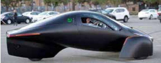
وتتمتع السيارة التي يصل ثمنها إلى 46900 دولار بالنسبة للنموذج رباعي الدفع، محركات كهربائية مزودة بالسائل، يقودها دفع السيارة الانتعاش من الصفر إلى سرعة 96 كيلومترا في الساعة في غضون 3.5 ثوان فقط، بينما تمل سرعتها القصوى إلى 177 كيلو مترا في الساعة.

كشفت شركة "أبتيرا" التي تتخذ من كاليفورنيا بالولايات المتحدة مقرا لها، عن سيارة تعمل بالبطاقة الشمسية ذات مواصفات "حارقة". وأعلنت الشركة عن نفاذ مراكبتها التي تعمل بالبطاقة الشمسية والكهربائية، ولا تحتاج إلى إعادة شحن أبداً وفقا لها، في أقل من 24 ساعة من طرحها للبيع، علما أن ثمن الواحدة يبدأ من 26 ألف دولار، وصمم هيكل السيارة من مواد خفيفة الوزن، الأمر الذي يوفر مقاومة هوائية منخفضة، كما أنها تدعم تقنية "نيفر تشارج"، القائمة على مجموعة من الخلايا الشمسية وحزمة بطاريات، والتي تتيح السير لمسافة ألف ميل أو ما يعادل 1609 كيلو مترا، لتجاوز بذلك الرقم الخاص بسيارة "سلا" من الطراز "إس"، البالغ 370 ميلا، حسبما ذكرت صحيفة "ديلي ميل" البريطانية.