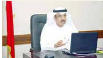
العليمي محمد بمنتهى "البلاد" تنكر الشفاهة بالبحرين في "اليوسكو"

توفير 665 حافلة تنقل 37 ألف طالب إلى المدارس شراء كتب جديدة بالتعاون مع السعودية