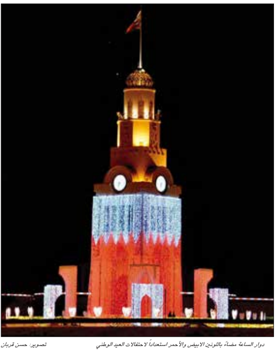
دوار الساعة مضاءً بالونين الأبيض والأحمر استعداداً لاحتفالات العيد الوطني

غيب الموت المخرج الكوري الجنوبي كيم كي دوك المعروف عالمياً بأعماله السينمائية ذات الطابع العنيف والمتهم بالتحرش بعملات، في ريفعا عاصمة لاتفيا، من جراء إصابته بفيروس كورونا. وقالت رئيس المركز الوطني للسليفا في لاتفيا، ديتا رينيتوما لوكالة فرانس برس «الأسف، نيا وفاة كيم كي دوك بسبب فيروس كورونا في لاتفيا صحیح». ولفتت إلى أنها تلقت معلومات من أشخاص بقوا على تواصل مع المخرج بأنه توفي في أحد مستشفيات العاصمة ريفعا، مشيرة إلى أنه كان في زيارة خاصة إلى لاتفيا من دون مشاريع تصوير.