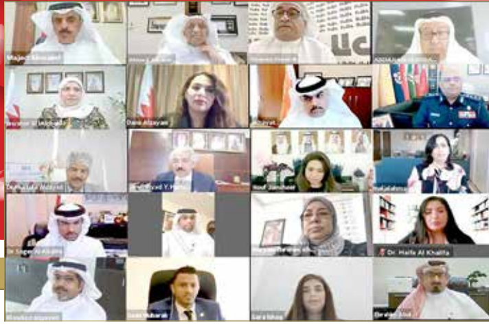
جانب من المشاركين بمنتهى "البلاد"