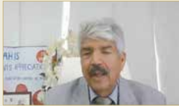
الأمين العام للمؤسسة الملكية للأعمال الإنسانية مندوبا في المنتدى

الدولة لمواظباتها، بل ما تقدمه أيضا للمتضررين والمحتاجين في شتى أنحاء العالم. إلى ذلك، أشاد السيد بما حققت حملة فيخا عبر التوزيع المبرمج لمرحلة الحملة وتوفير الحواسيب الآلية للطلبة المحتاجين وتوفير المواد الغذائية للبحرانيين والمقيمين من المحتاجين المتضررين مما ساهم في الاستقرار الأمني والتربوي للجميع.