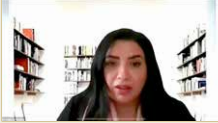
الشيخة هيفاء بنت إبراهيم بنت محمد آل خليفة

♦ قالت إن إنشاء "الأعلى للمرأة" من أهم الإنجازات للمواطنة