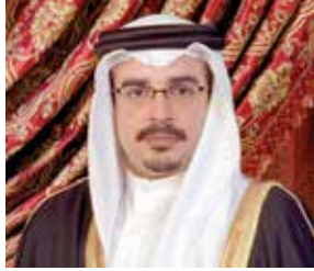
○ سمو ولي العهد رئيس الوزراء.

الجائحة اجتذبتوا بلاء جائحة الملك المعدي وصاحب سمو ولي العهد رئيس الوزراء لمختلف مشاعرهم الوطنية ويقدموا الحب والولاء ويجندوا البيعة الإيمانية.